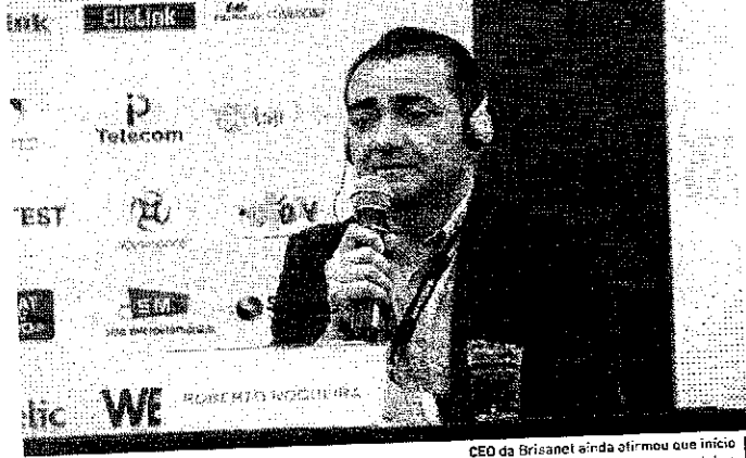
CEO da Brisanet ainda afirmou que início da operação está previsto para outubro

ARMANDO DE OLIVEIRA LIMA armando.lima@opovo.com.br